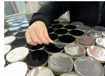
mit Stanniol zudecken couvrir avec la feuille d'argent