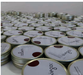
Deckel anbringen mettre le couvercle