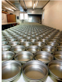
bereitstellen der Dosen poser les boîtes