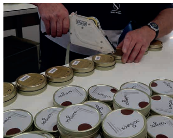
mit EAN-Code bekleben coller le code EAN