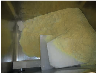
mischen der Wachse mélanger les cires

Der neue Glanz aus Schweizer Manufaktur siegol.ch