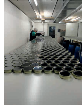
abfüllen in 2 Schritten remplir en 2 étapes